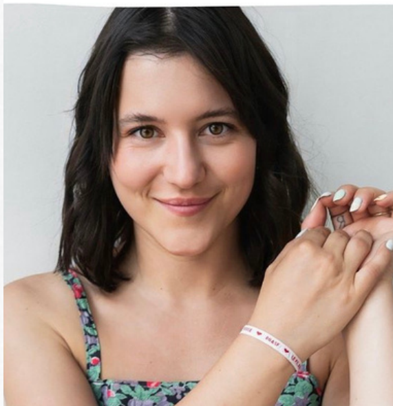
Ensemble vers l'équité menstruelle

28 MAI - JOURNÉE MONDIALE DE LA SANTÉ MENSTRUELLE